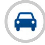
คณะกรรมการประกันภัยยานยนต์