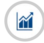
คณะกรรมการพัฒนาธุรกิจและวิชาการประกันภัย