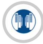
โครงการพัฒนาระบบฐานข้อมูลกลางด้านการประกันภัย (IBS)