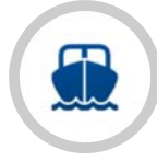
คณะกรรมการประกันภัยทางทะเล และโลจิสติกส์