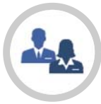
รายนามเจ้าหน้าที่ด้านการประกันภัยประเภทต่างๆ