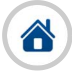
คณะกรรมการประกันภัยทรัพย์สิน