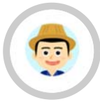
โครงการประกันภัยพืชผล