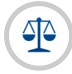
คณะกรรมการกฎหมายและกฎระเบียบ