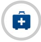
คณะกรรมการประกันภัยอุบัติเหตุและสุขภาพ