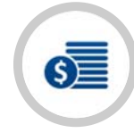
คณะกรรมการการบัญชี-การเงิน และการลงทุน