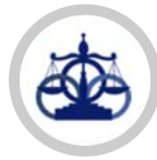
สำนักงานอนุญาโตตุลาการ