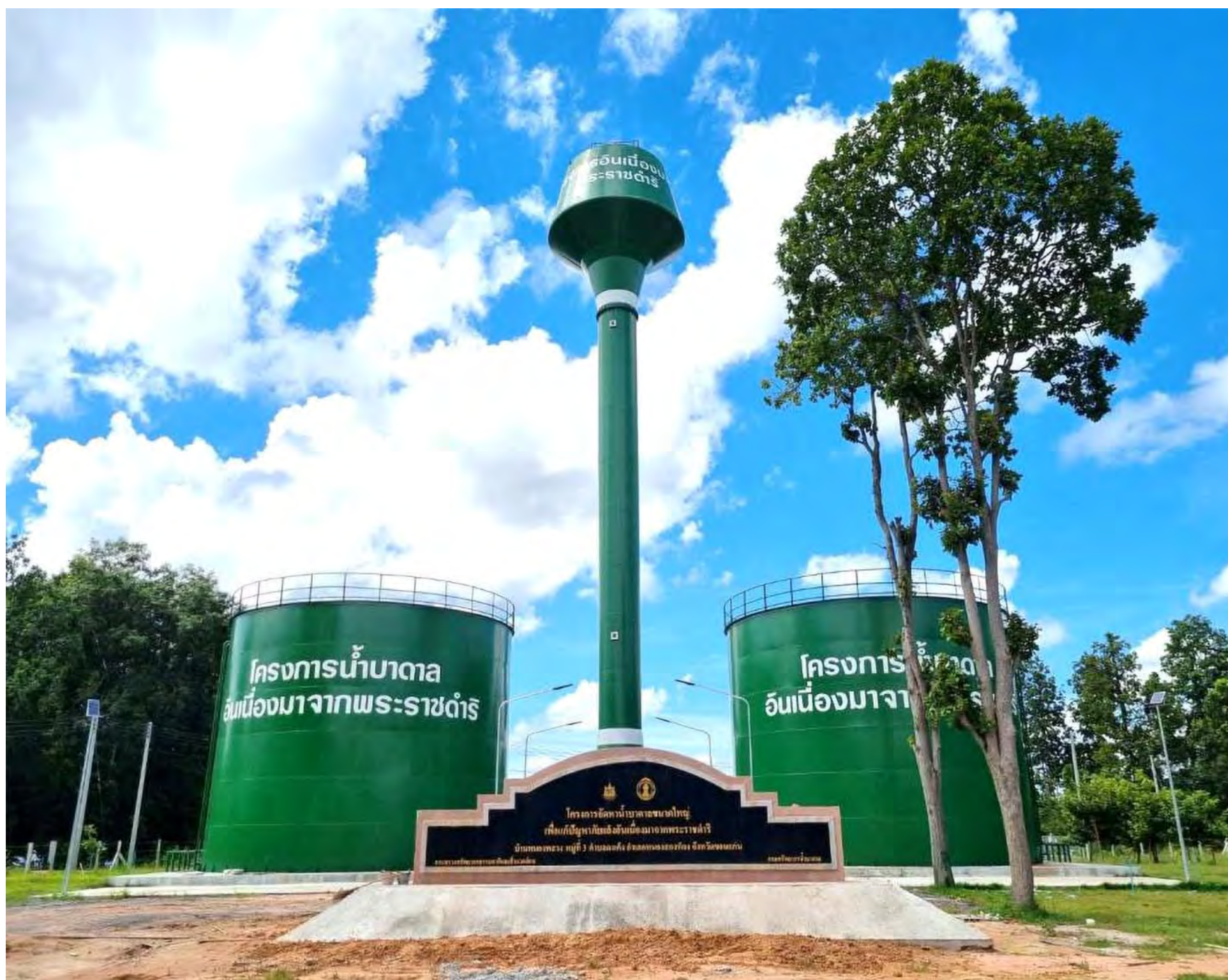
โครงการจัดหาน้ำบาดาลขนาดใหญ่แก้ปัญหาภัยแล้งอันเนื่องมาจากพระราชดำริ พื้นที่ตำบลบางแก้ว อำเภอมะนัง จังหวัดยะลา